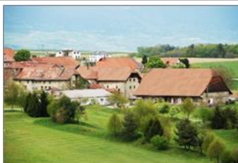
Vue du village de Vuissens

Dossier aux conditions d'approbation en cours (2021)