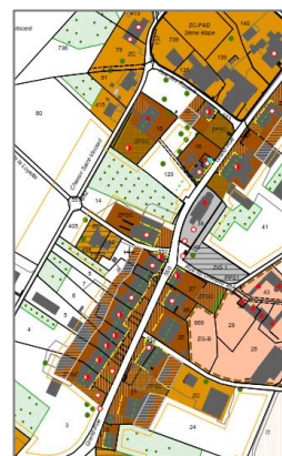
Extraits du plan d'affectation et zoom sur le centre village (2018)